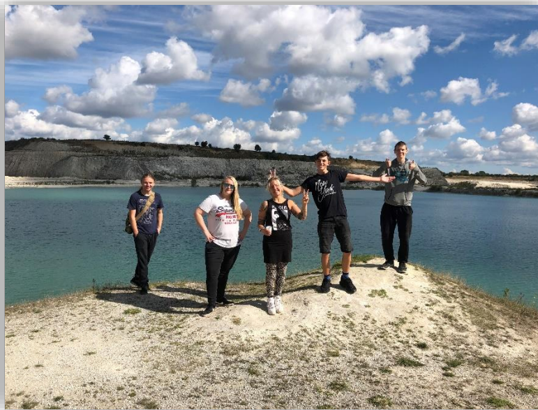
Fra turen til Geomuseet. Her fra kalkgraven.

Vi sluttede dagen af med hygge i tipien i Rødvig hytteby. En dejlig dag med gode oplevelser.